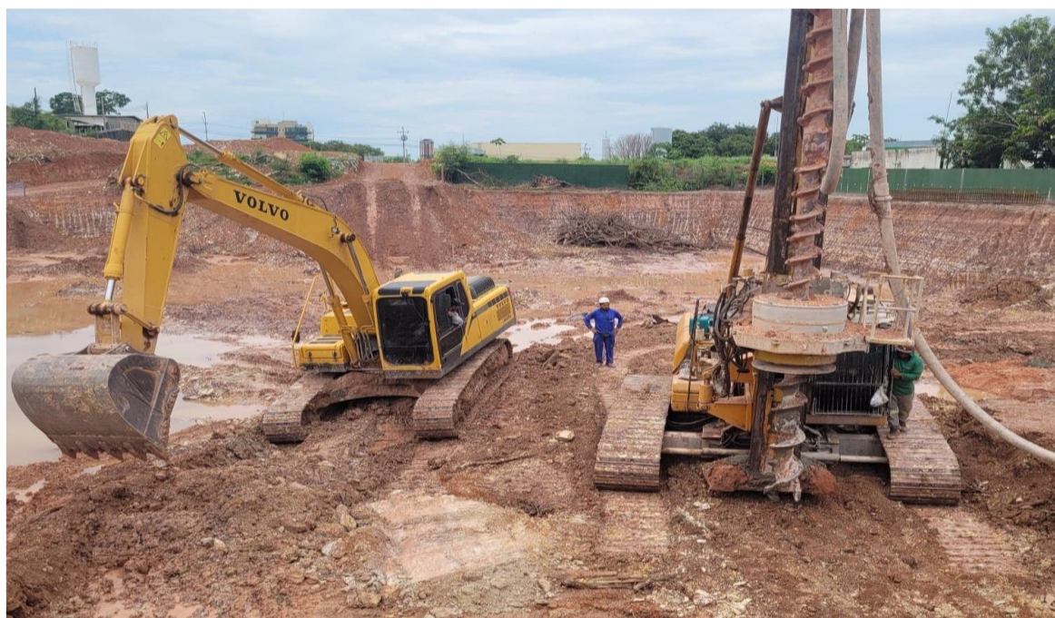
Preparação para ensaio da prova de carga das sapatas – Novembro 2024