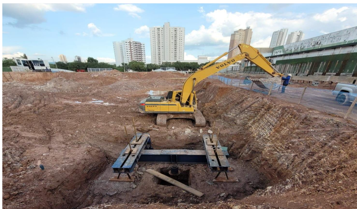
Ensaio da prova de carga as sapatas – Novembro 2024