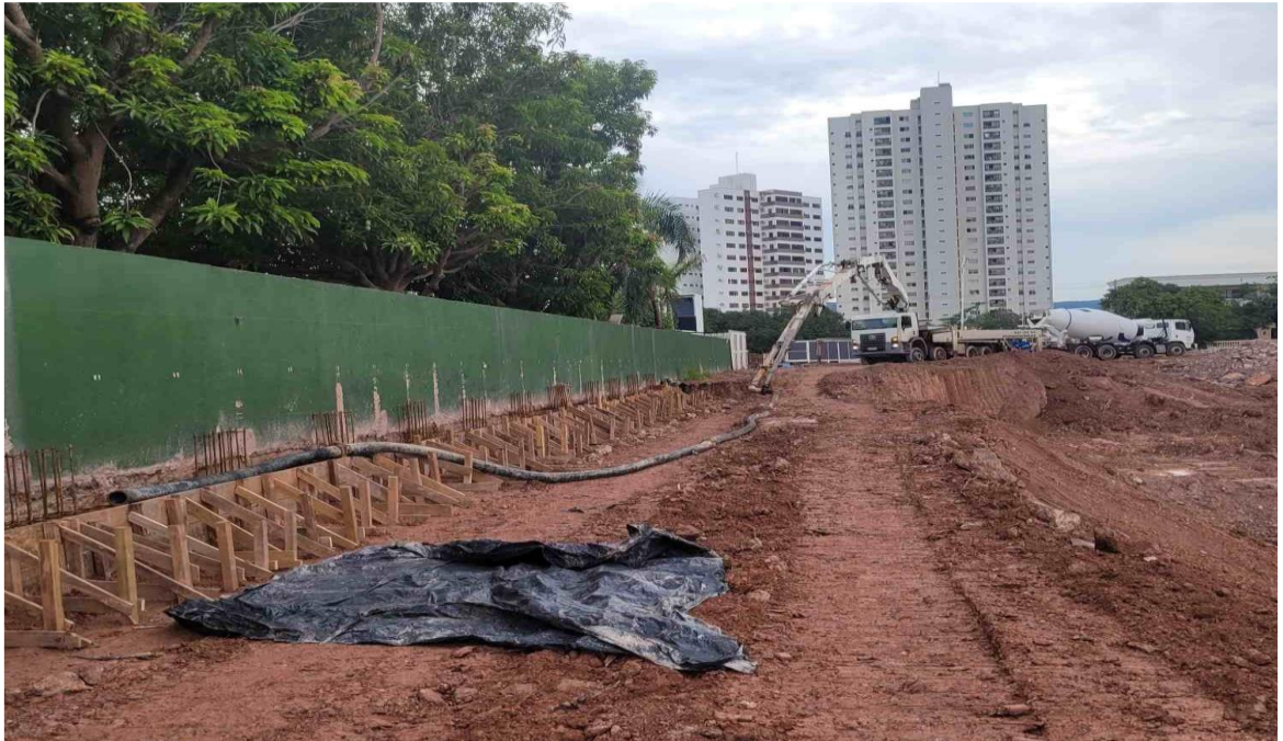
Vigas de coroamento da contenção – Dezembro 2024