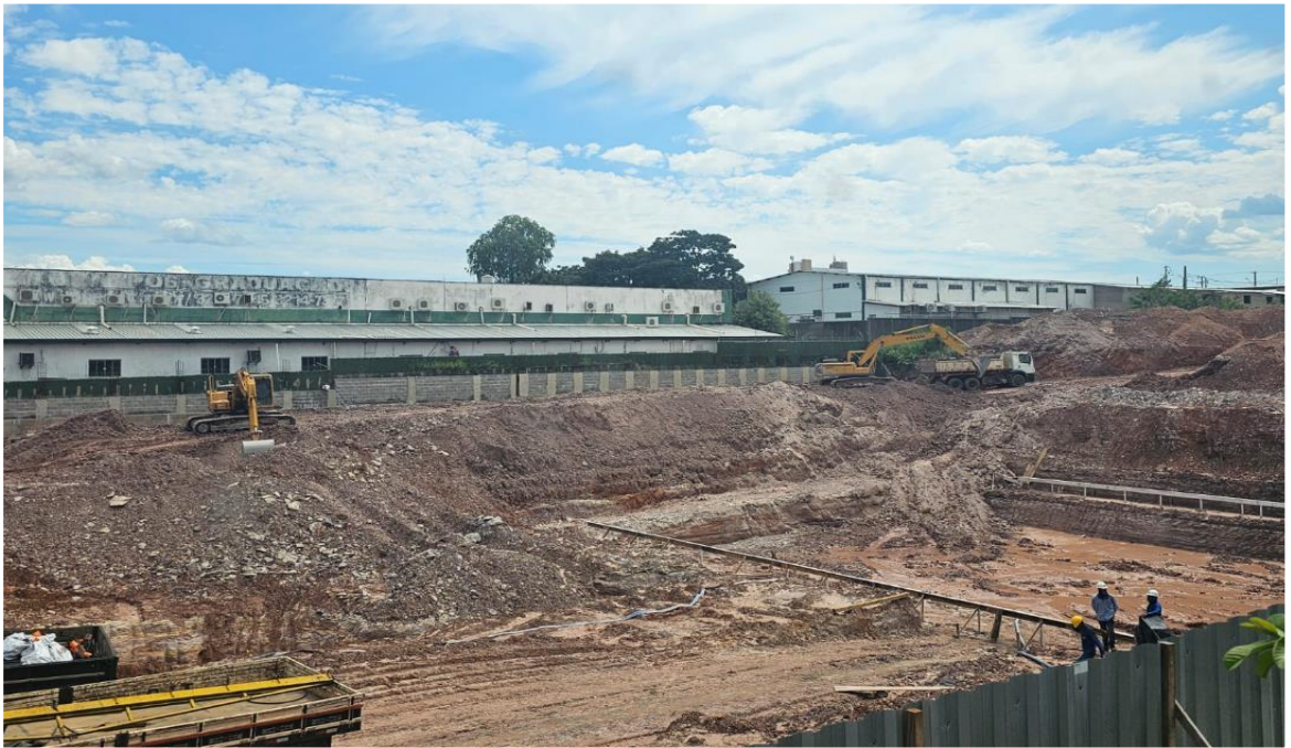
Escavação e gabarito – Dezembro 2024 e Janeiro 2025