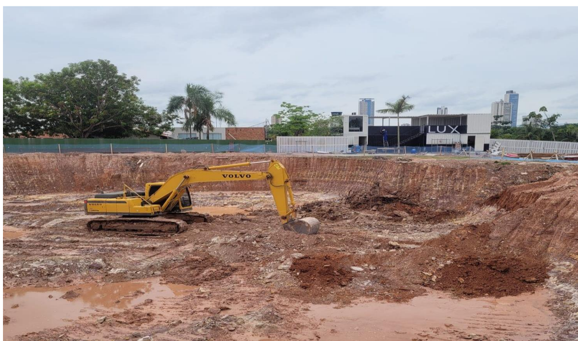
Escavação etapa 1 – Até nível do térreo – Novembro 2024