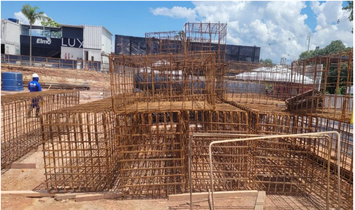
Início da armação das sapatas de fundação – Janeiro 2025