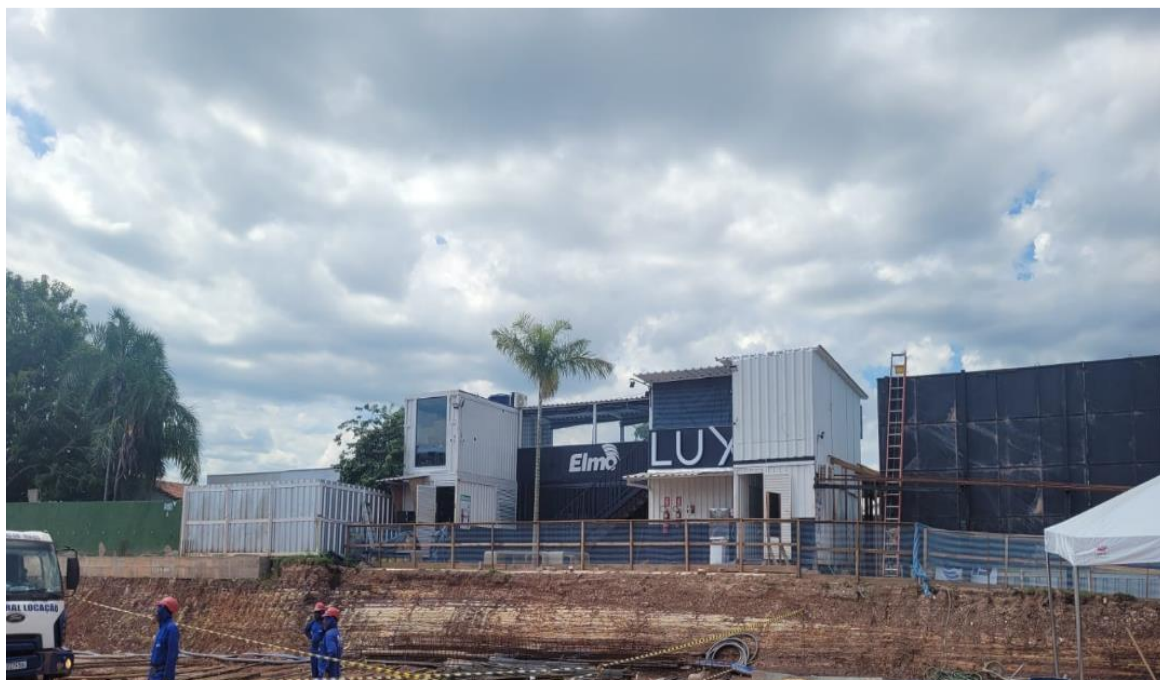
Canteiro de obras – Novembro 2024