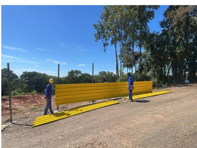
Execução do tapume – Fevereiro 2026