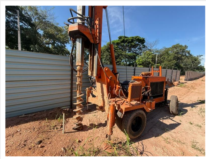
Execução das estacas de contenção – Abril 2026