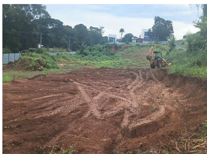
Execução da movimentação de terra – Março 2026