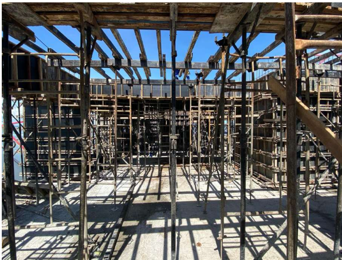
Montagem da forma da estrutura do 22º pavimento – Fevereiro 2024