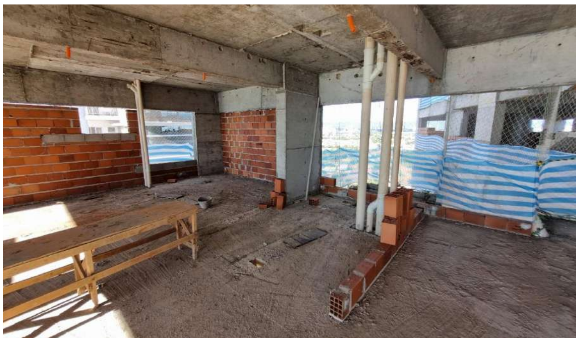
Execução da alvenaria e prumadas hidrossanitárias do 22º pavimento – Abril 2024