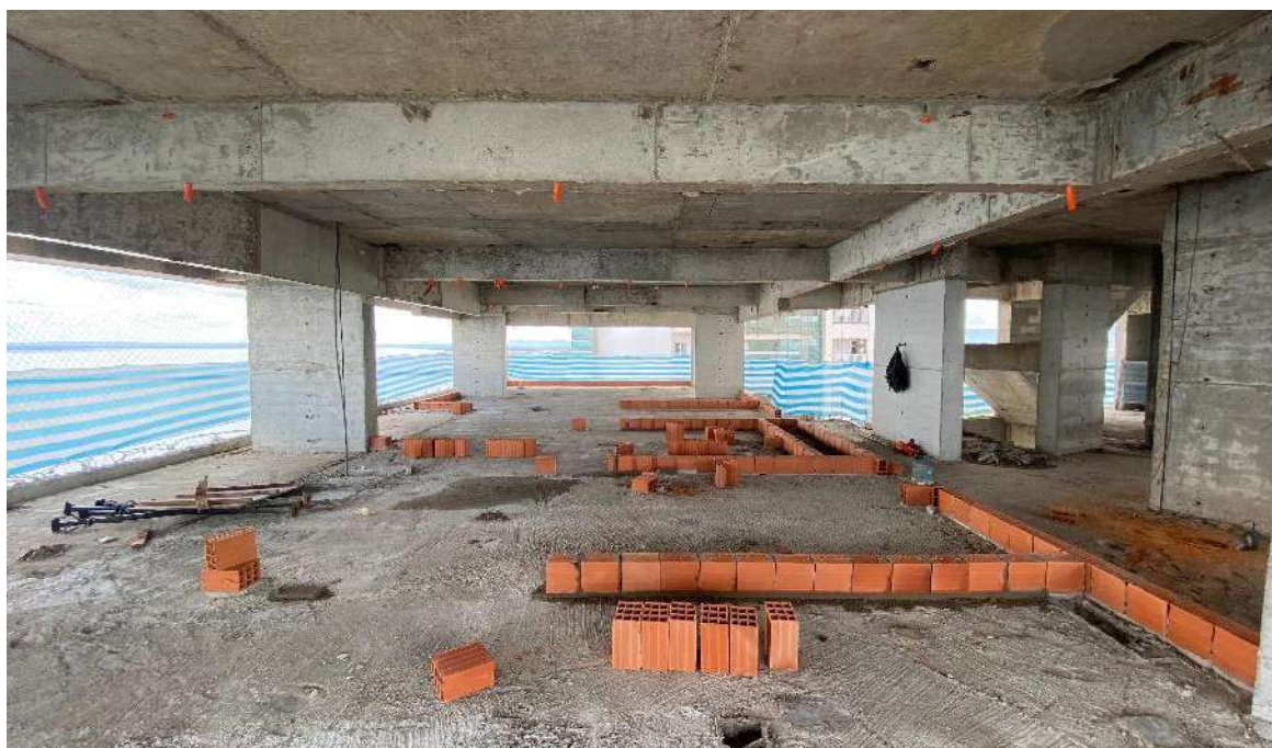
Marcação da 1ª fiada do 19º pavimento – Março 2024