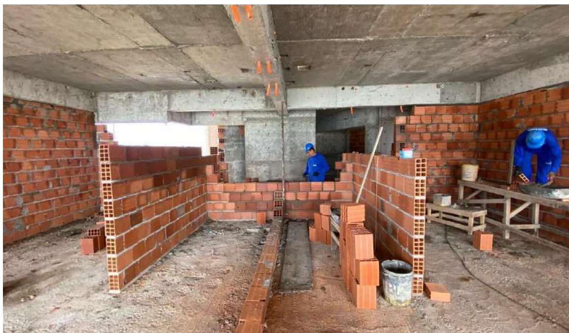
Execução de alvenarias internas no 14º pavimento – Fevereiro 2024