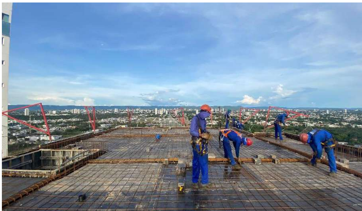
Montagem da forma e armação do 25º pavimento – Março 2024