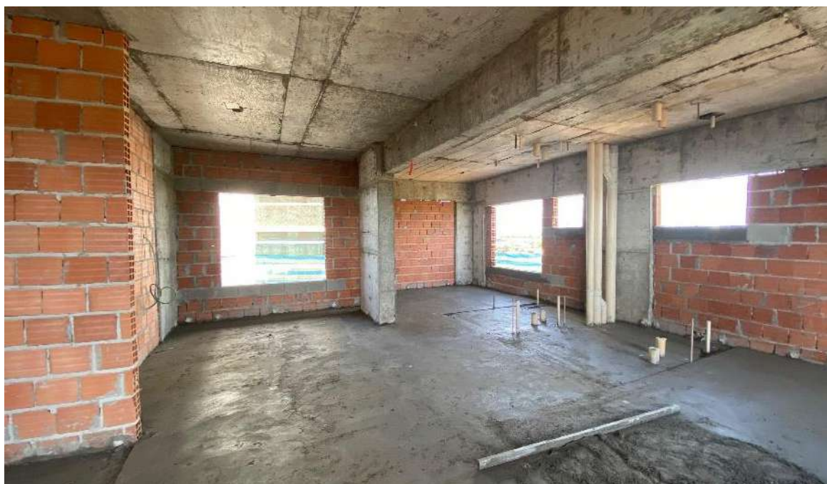
Execução do contrapiso dos apartamentos no 12º pavimento – Março 2024