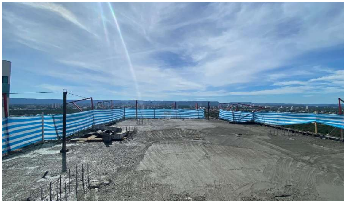
Concretagem da laje do 29º pavimento – Abril 2024