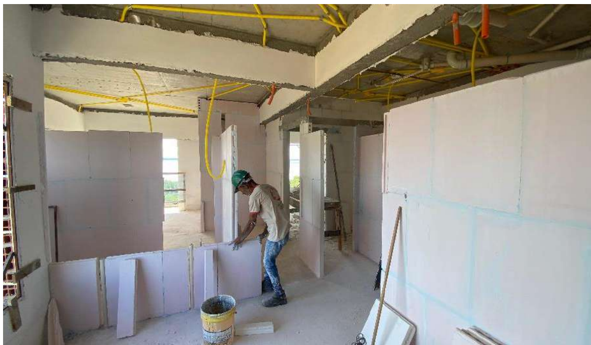
Assentamento de bloco de gesso do 5º pavimento – Março 2024