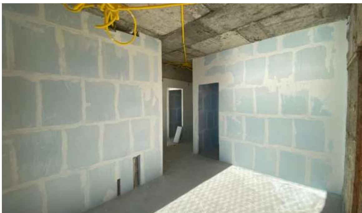
Assentamento de bloco de gesso do 14º pavimento – Julho 2024