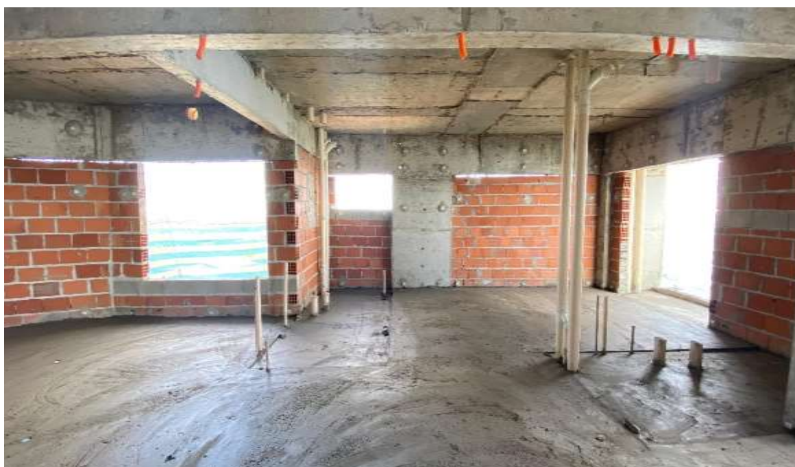
Execução do contrapiso dos apartamentos do 20º pavimento – Junho 2024