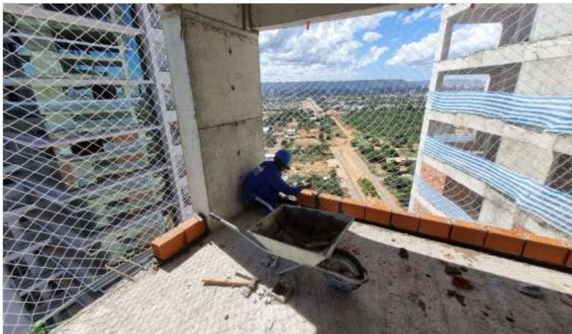
Marcação e execução da 1ª fiada de alvenaria do 24º pavimento – Maio 2024