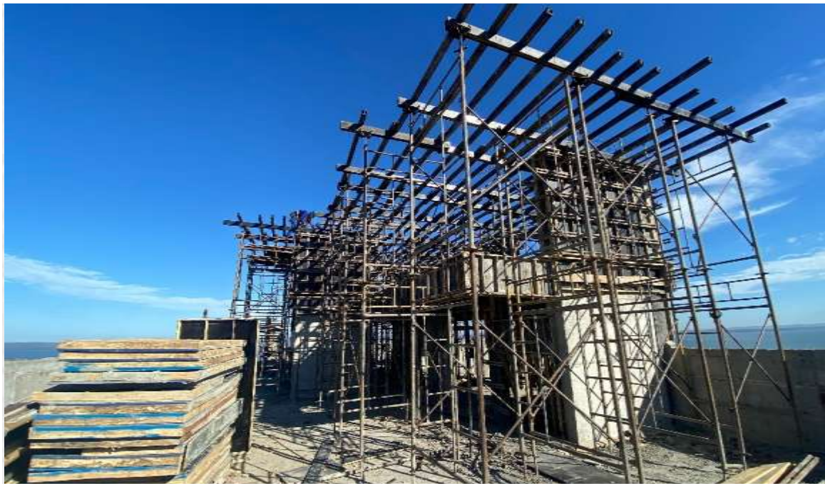
Montagem de formas do reservatório superior – Junho 2024