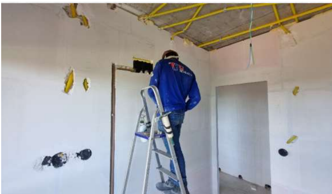
Instalação de caixas elétricas e dreno de ar condicionado do 8º pavimento – Maio 2024