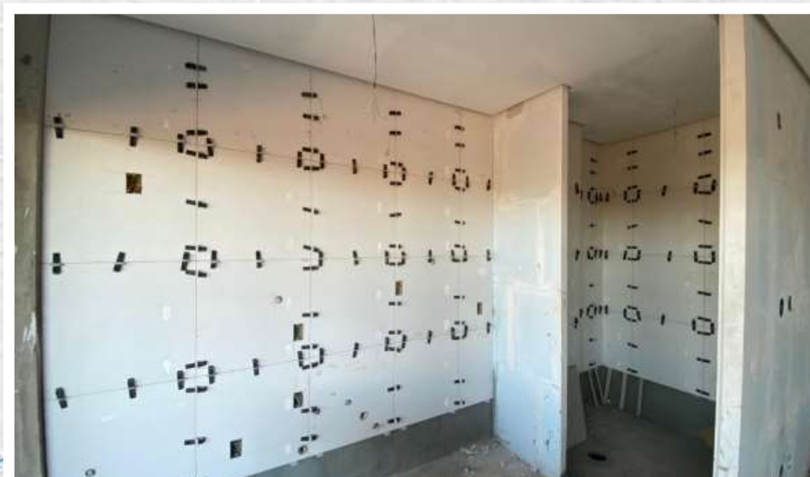
Execução de revestimento cerâmico de parede do 3º pavimento – Julho 2024