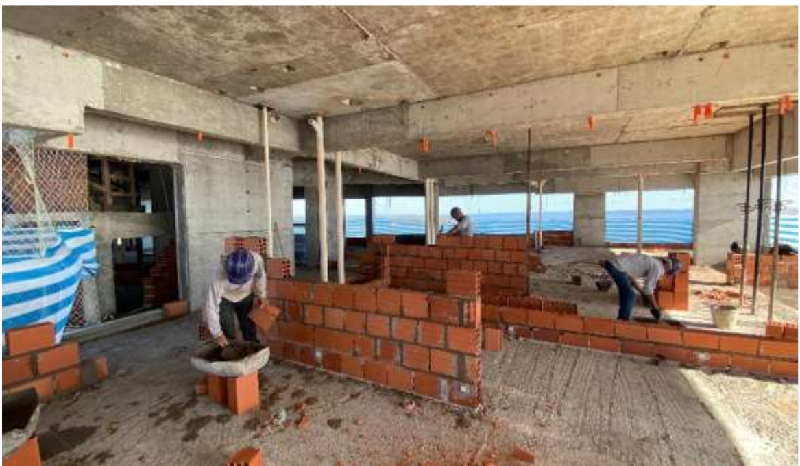
Execução de alvenarias internas do 23º pavimento – Maio 2024