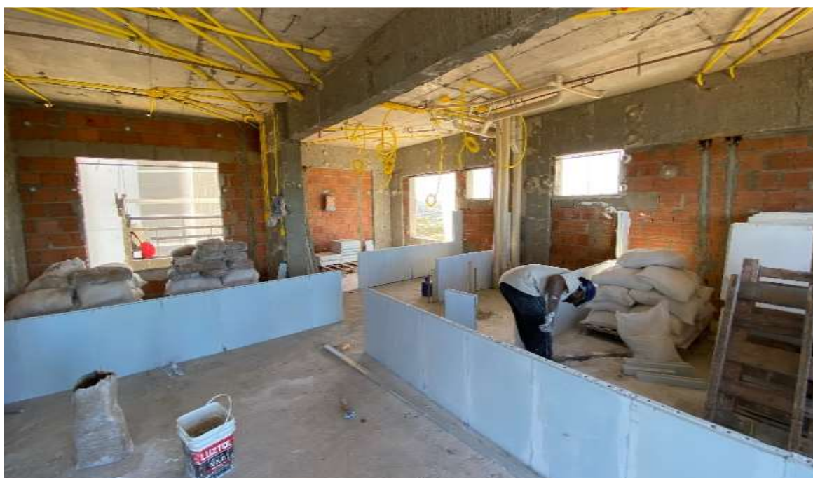
Assentamento de bloco de gesso do 14º pavimento – Junho 2024