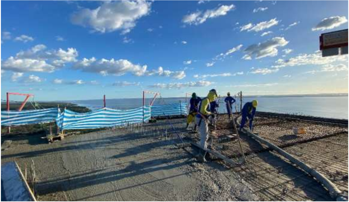
Concretagem da laje da cobertura – Maio 2024