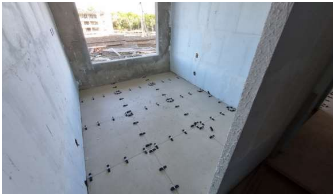
Execução de revestimento cerâmico de piso do 3º pavimento – Julho 2024