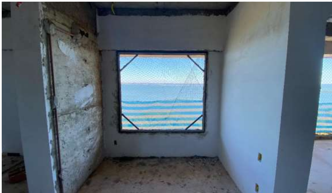
Chumbamento de contramarco no 13º pavimento – Junho 2024