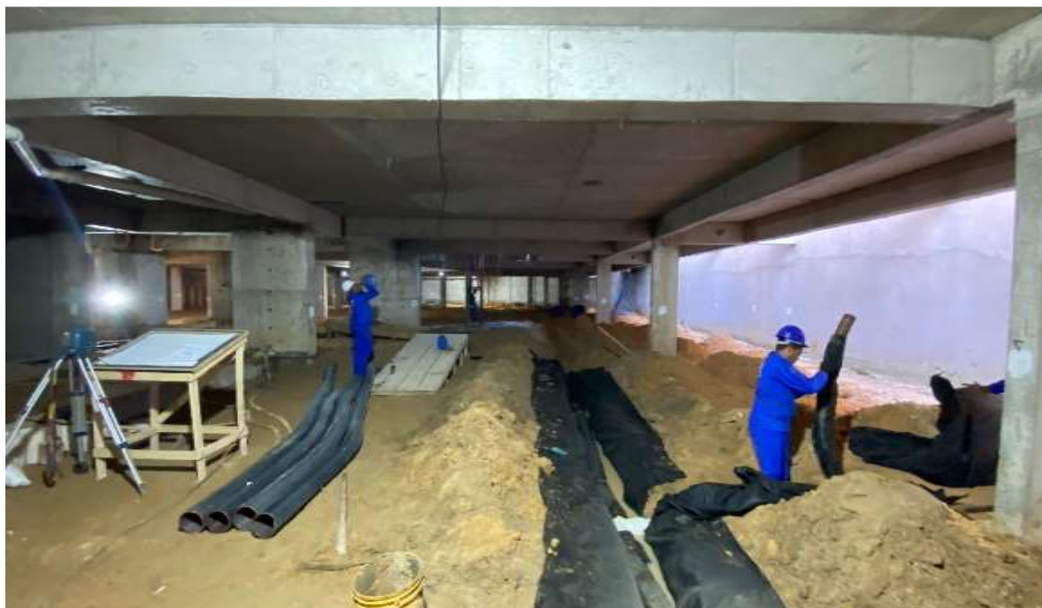
Drenagem do subsolo – Junho 2024