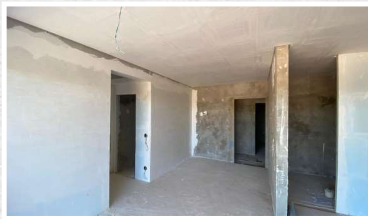
Forro de gesso do 4º pavimento – Julho 2024