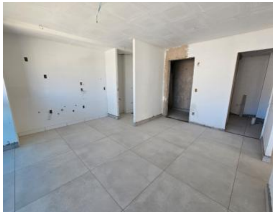
Limpeza e proteção dos revestimentos cerâmicos (20° Pavimento) – Outubro 2025