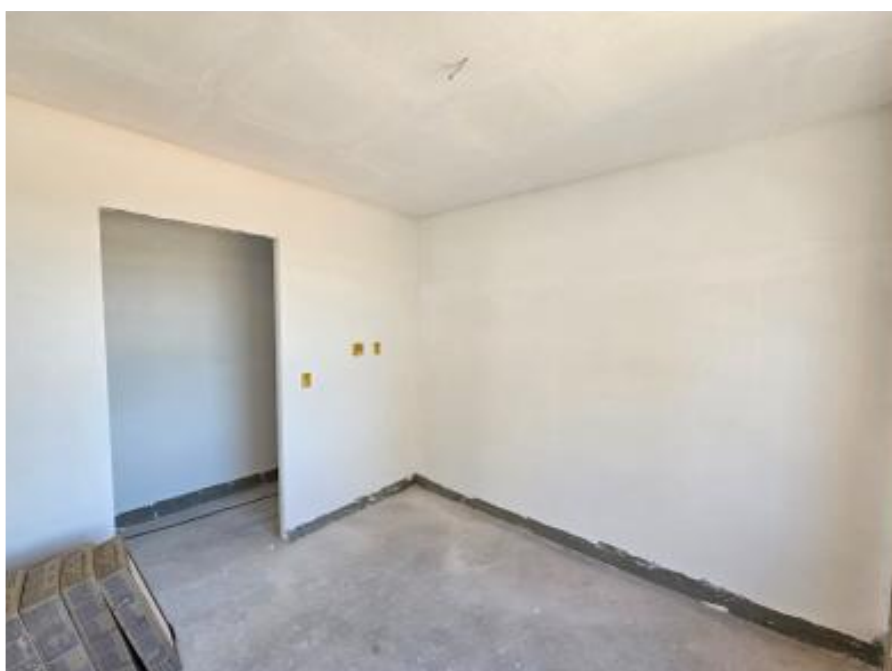
Execução do forro de gesso (33º pavimento) – Outubro 2025