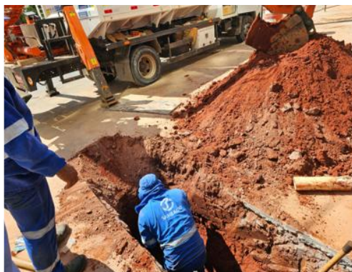
Ligação definitiva da rede de esgoto – Setembro 2025