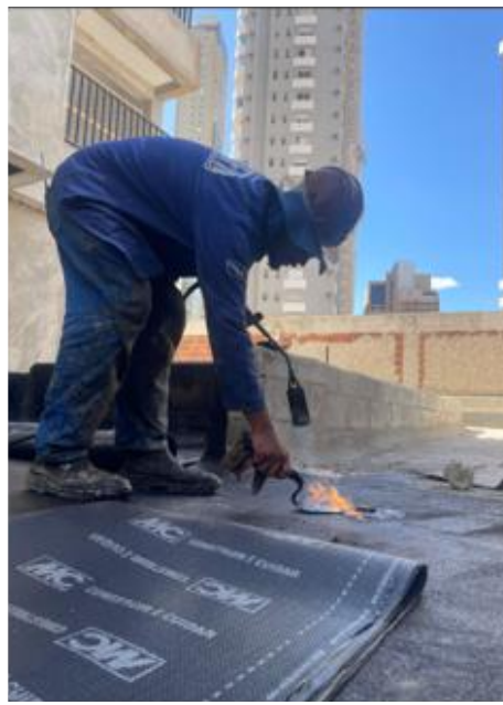
Impermeabilização das piscinas – Agosto 2025