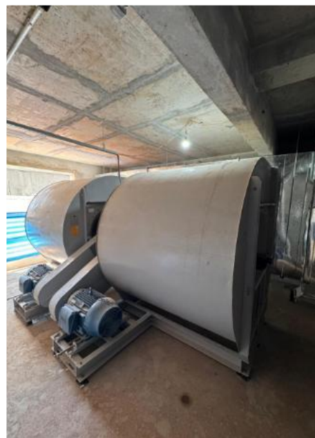
Instalação do gerador e motores da pressurização – Outubro 2025