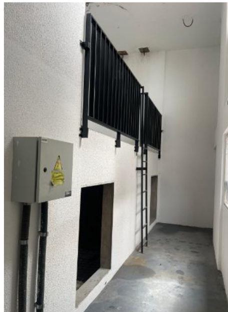
Preparação do poço do elevador para instalação – Outubro 2025