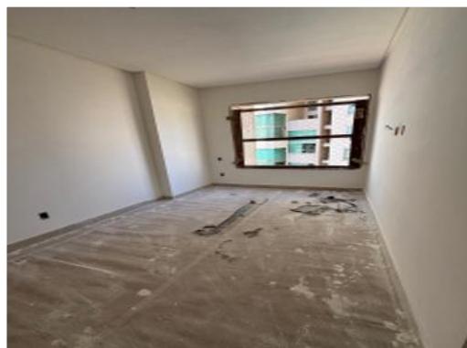
Emassamento do 10º pavimento – Setembro 2025