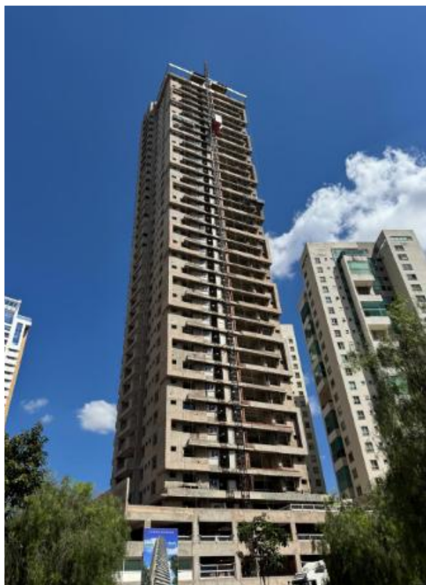
Fachada frontal – Outubro 2025