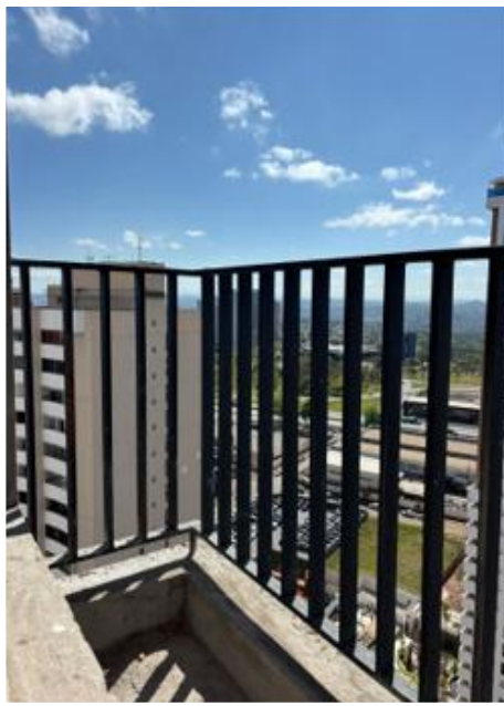
Instalação de guarda corpo metálico – Agosto 2025