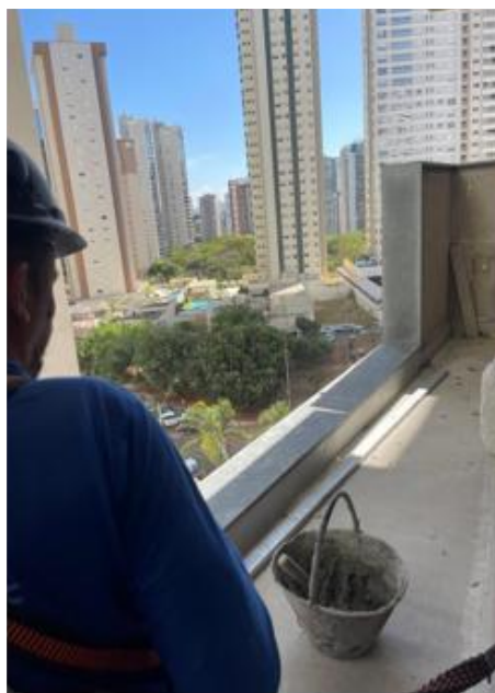
Assentamento de peitoril – Agosto 2025