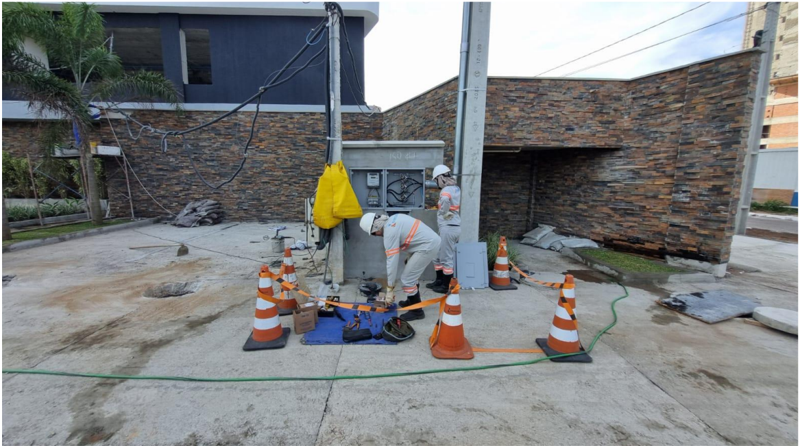
Ligação definitiva da concessionária de energia – Agosto 2025