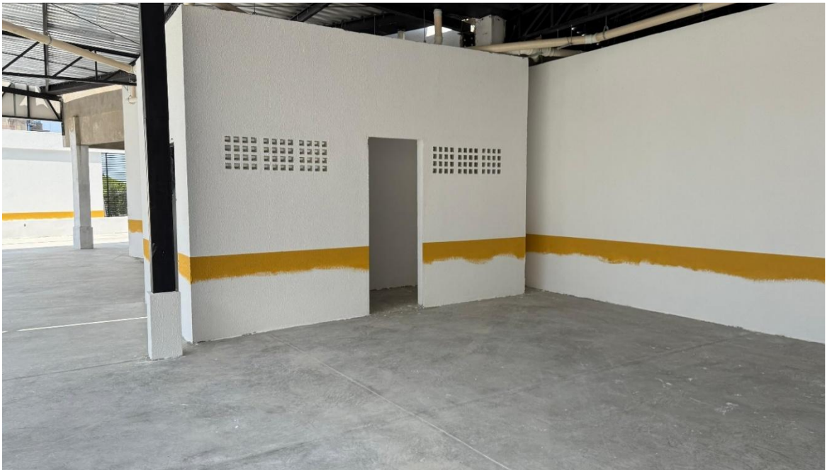
Pintura da garagem e demarcação do pavimento garagem 2 – Setembro 2025