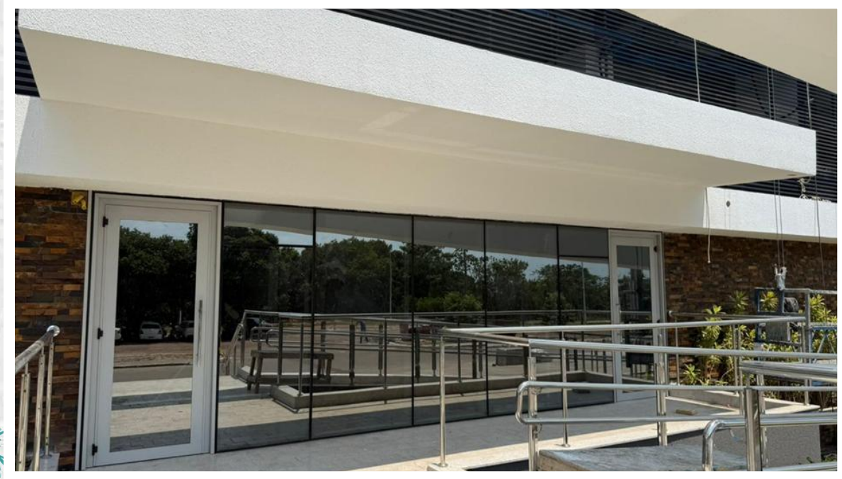
Entrada principal – Outubro 2025