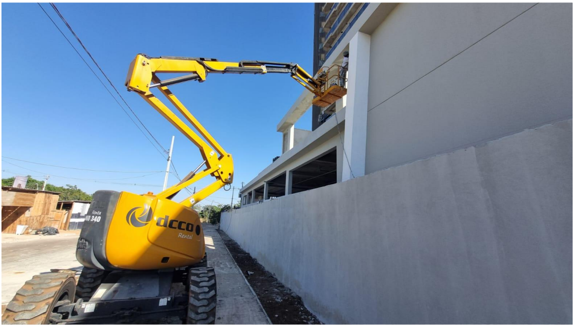
Pintura da fachada lateral – Agosto 2025