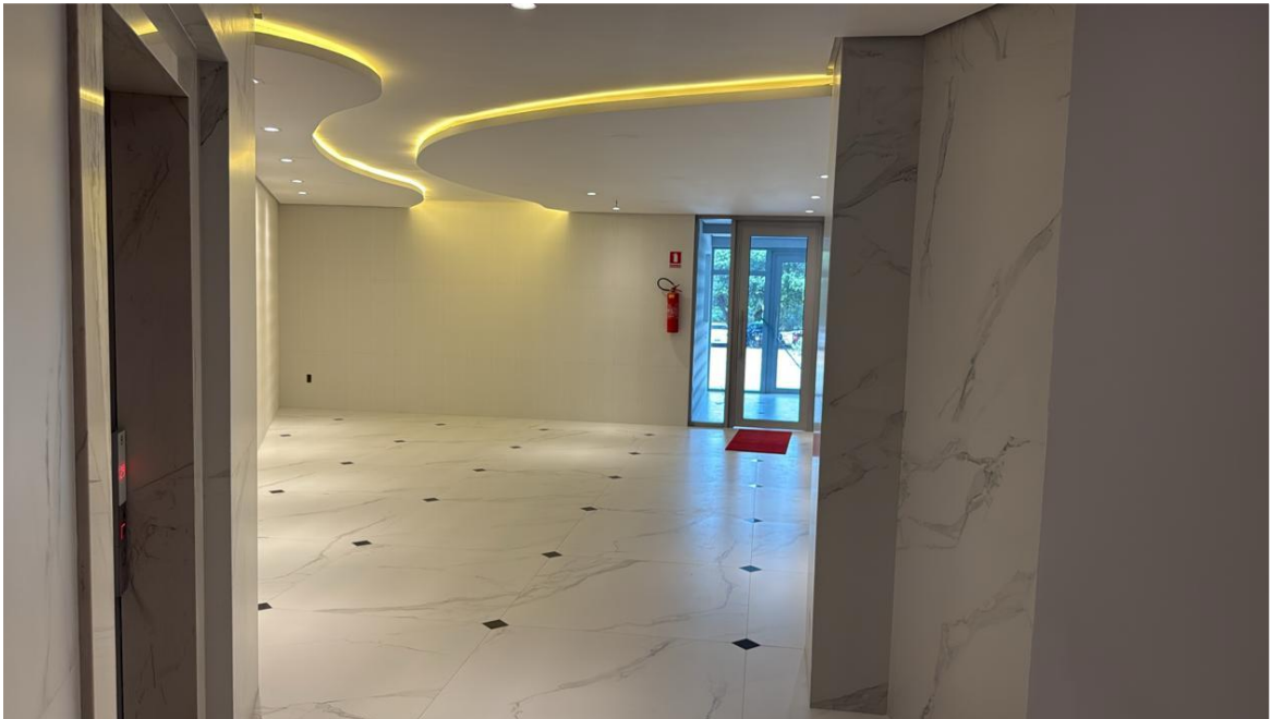
Lobby - Térreo – Setembro 2025