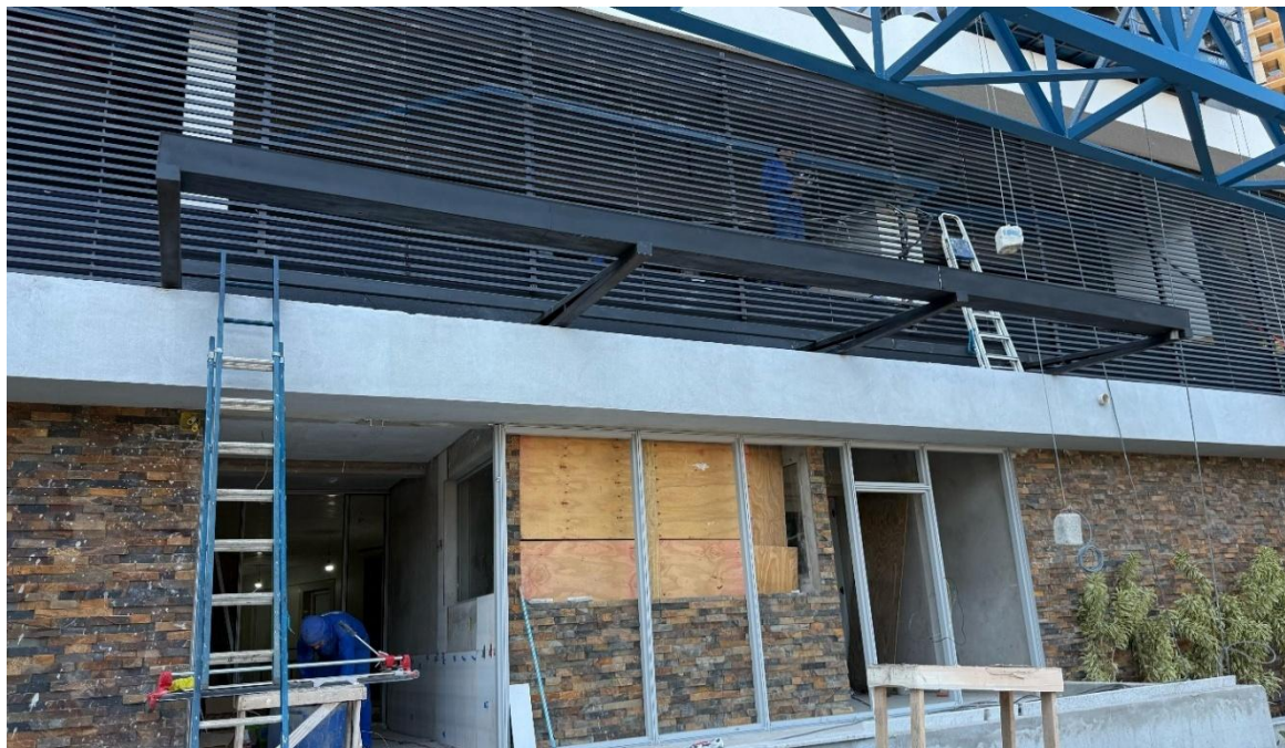
Instalação do brise da fachada frontal – Agosto 2025