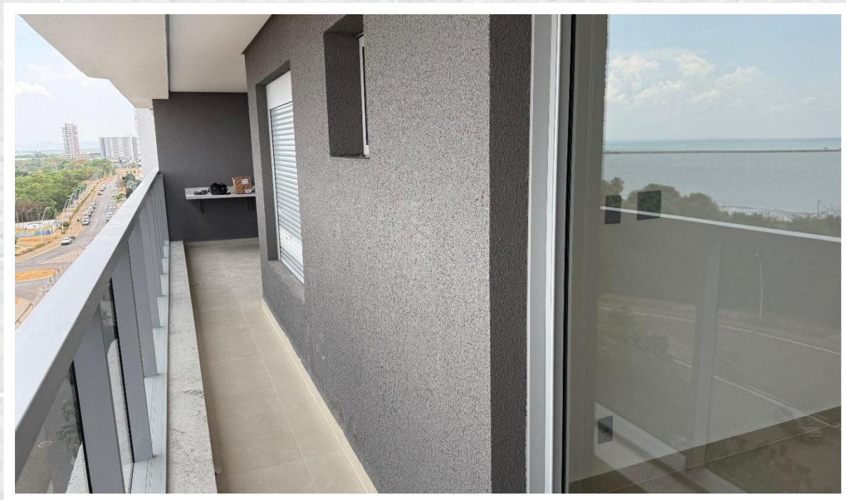
Pintura das varandas do 13° pavimento – Setembro 2025