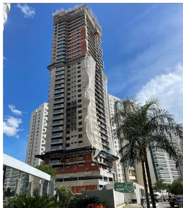
Execução do reboco externo – Janeiro 2025