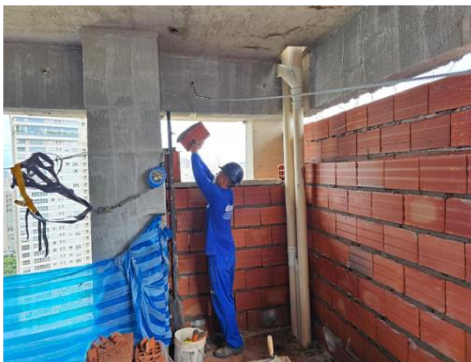
Alvenaria externa e interna do 30º pavimento – Janeiro 2025