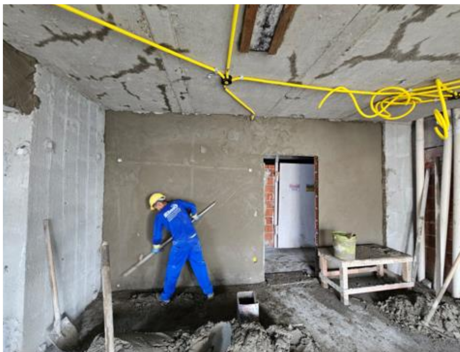
Execução do reboco interno do 20º pavimento – Janeiro 2025