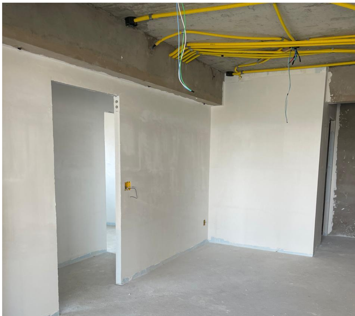
Execução de divisórias internas do 4º pavimento – Novembro 2024