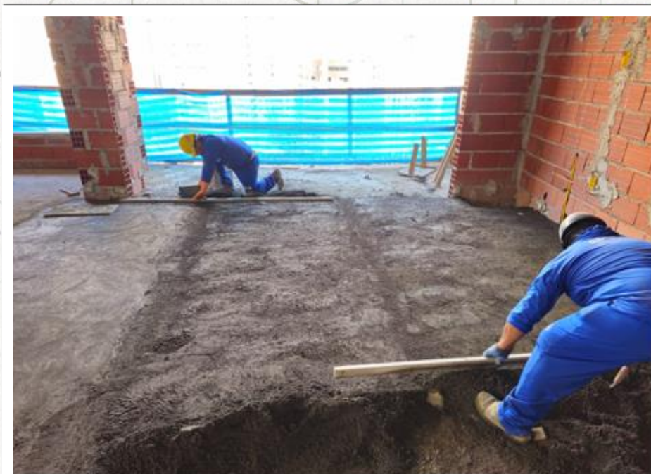
Execução do contrapiso do 24º pavimento – Dezembro 2024