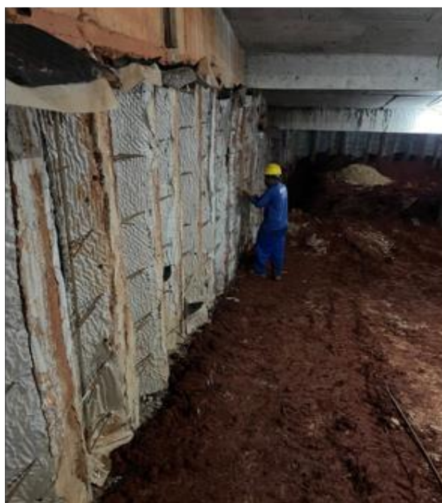
Estrutura de drenagem do subsolo 2 – Dezembro 2024