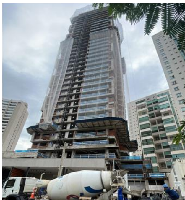
Concretagem da cobertura – Janeiro 2025